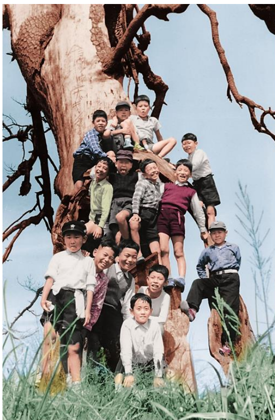
〈1959年 植替え直前の弘法の松〉

この辺りは古代より交通の要衝で、東国から西国・九州へ行く人々はここを通りました。