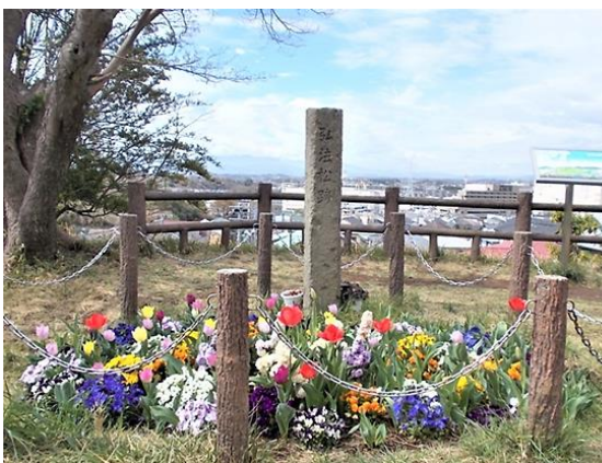
〈焼失した弘法の松の跡〉

市制100周年記念・白黒写真カラー化プロジェクトの写真を見ると、弘法の松の大きさが分かります。